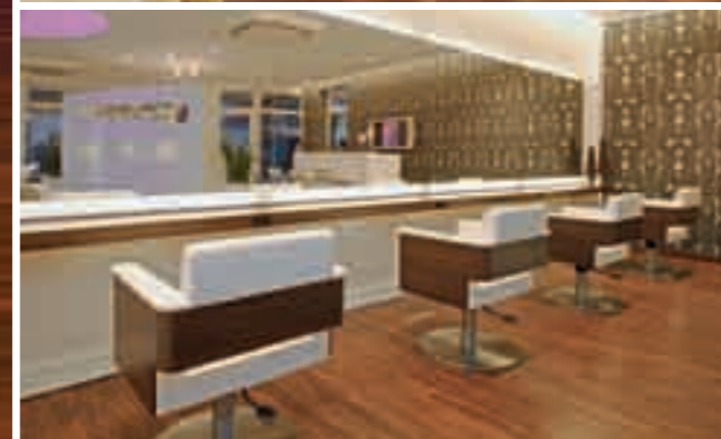
kpOchs LOOP5 Weiterstadt Germany