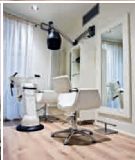
SORELLE FONTANA Perugia Italy