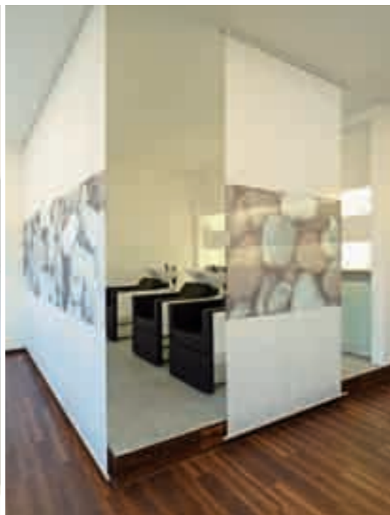
HAUS SALM Bonn Germany