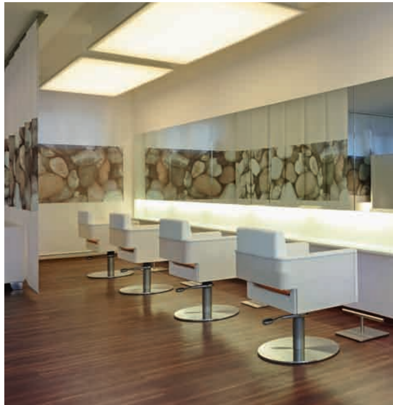
LARIAI HAIRLIVE Reutlingen Germany