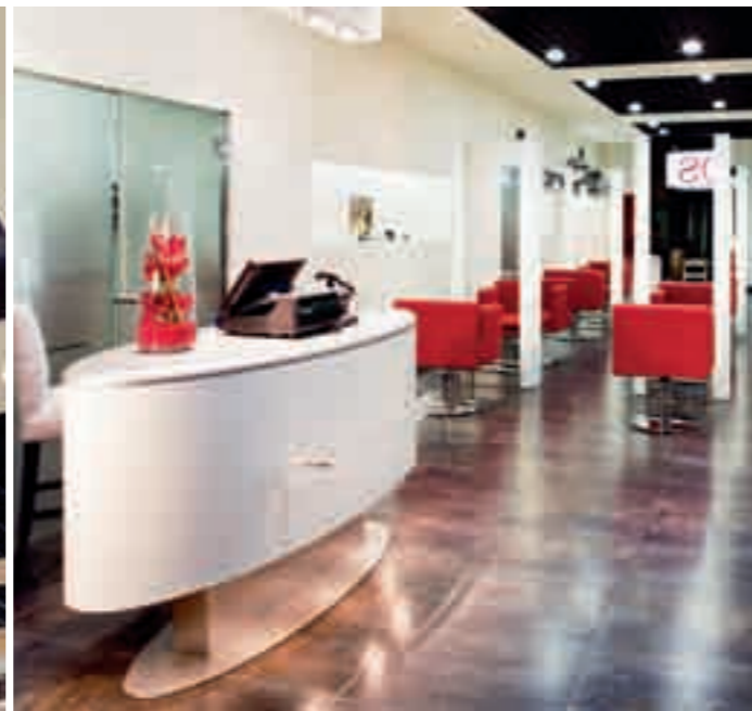
ZACHA PELUQUEROS Madrid Spain